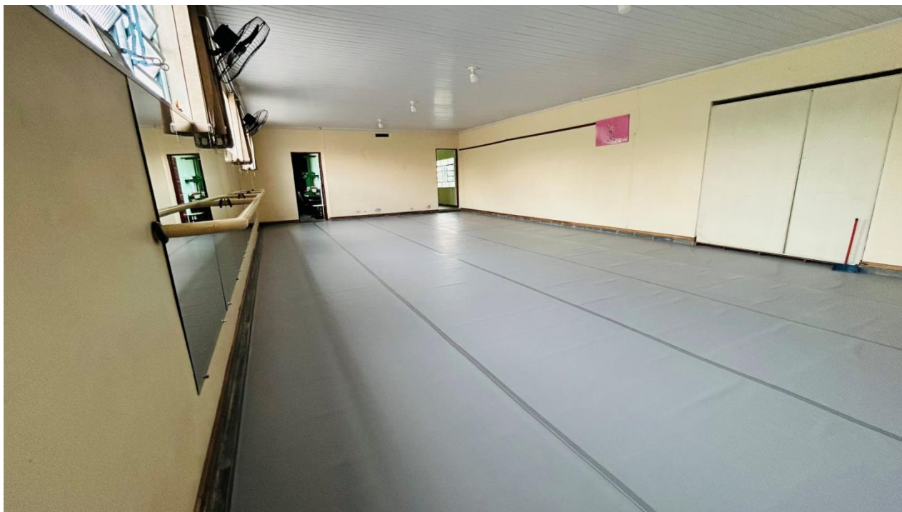
Sala de Teatro

Utilidade pública municipal nº 1957 de 15/02/78-processos nº 3288/77 p.m. e 077/77