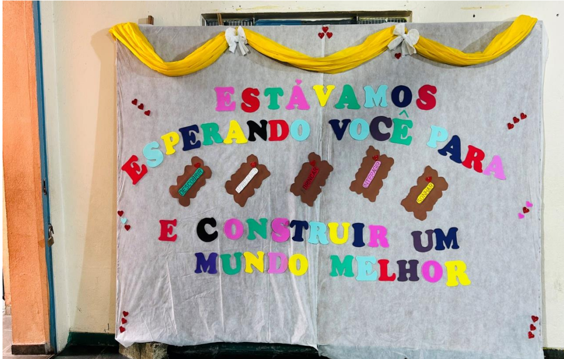
Sala de Ritmos