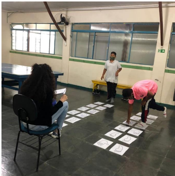
Usuários realizando a oficina de recreação