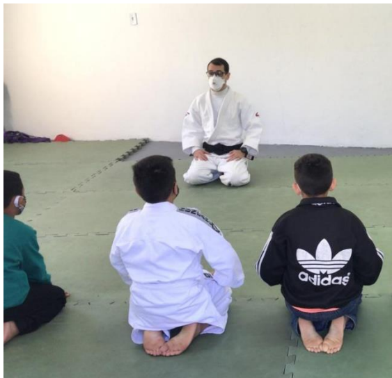
Usuários realizando a oficina de judô

CNPJ: 47.335.658/0001-18 cmdca: registrado sob nº 06 cmas: registrado sob nº 12 Utilidade pública municipal nº 1957 de 15/02/78-processos nº 3288/77 p.m. e 077/77