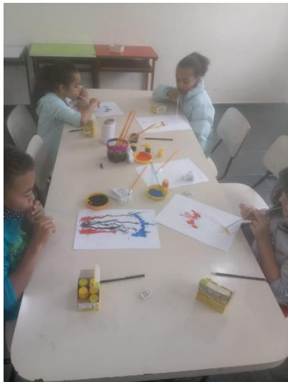
Usuários realizando a oficina de artes