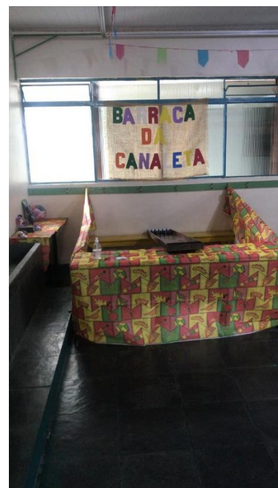
Barraca da canaleta para realização da festa junina