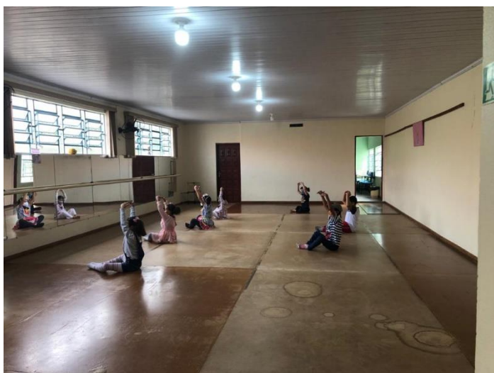
Usuários realizando a oficina de danças