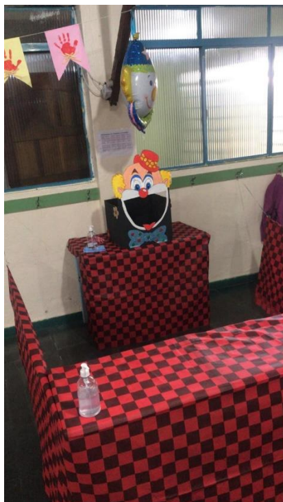
Barraca da boca do palhaço para realização da festa junina