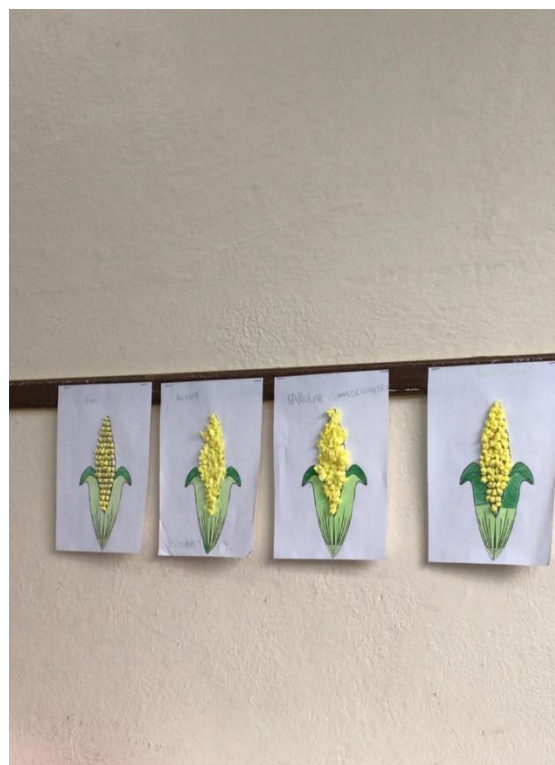
Atividade realizada pelos usuários