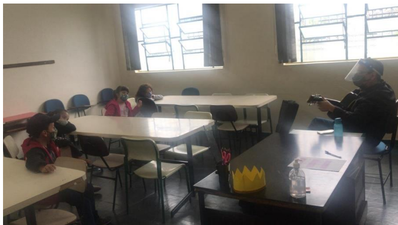
Usuários realizando a oficina de musica