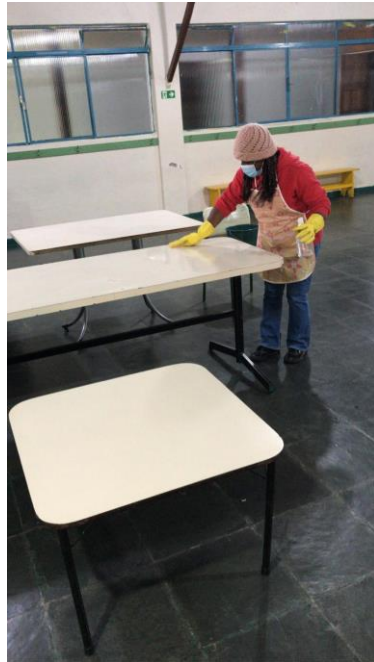
Remanejamento e organização dos espaços da entidade