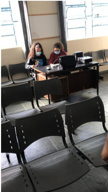
Remanejamento e organização dos espaços da entidade