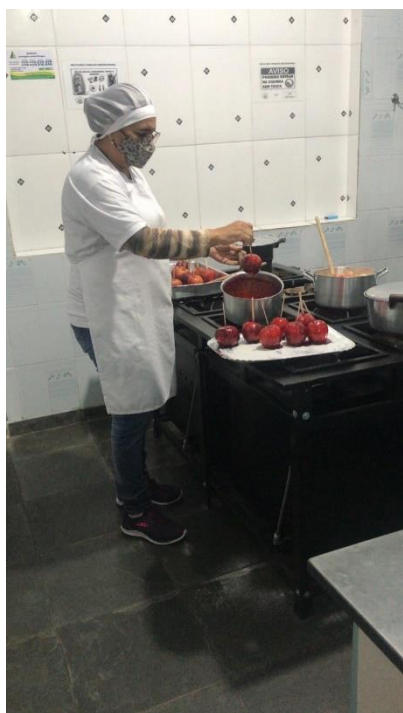
Preparação para a festa junina dos usuários

CNPJ: 47.335.658/0001-18 cmdca: registrado sob nº 06 cmas: registrado sob nº 12 Utilidade pública municipal nº 1957 de 15/02/78-processos nº 3288/77 p.m. e 077/77