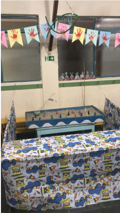
Barraca da pescaria para realização da festa junina

CNPJ: 47.335.658/0001-18 cmdca: registrado sob nº 06 cmas: registrado sob nº 12 Utilidade pública municipal nº 1957 de 15/02/78-processos nº 3288/77 p.m. e 077/77