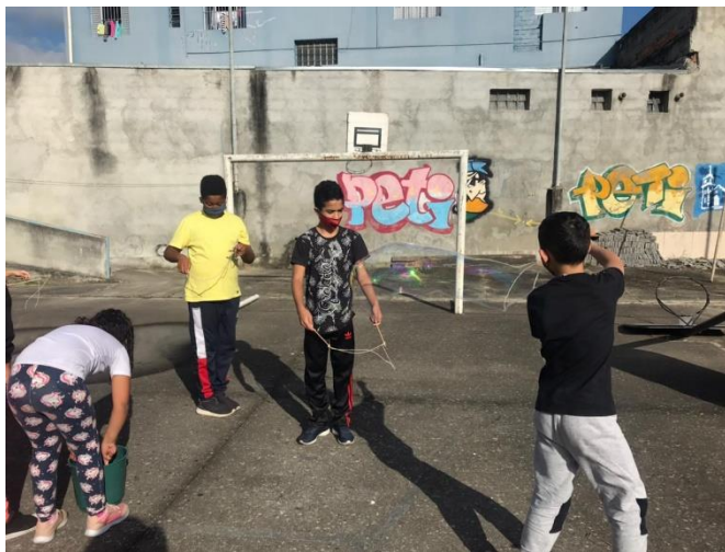
Usuários realizando a oficina de recreação